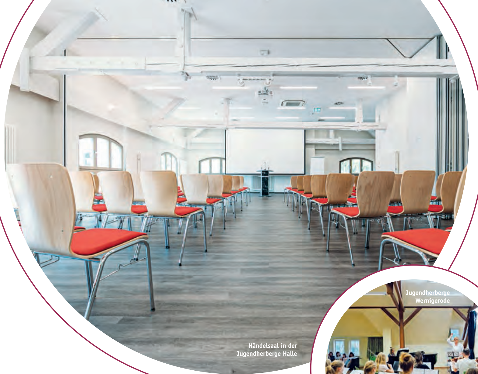
Händelsaal in der Jugendherberge Halle